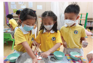
紫晴、靜嵐及泓泓透過閱讀食譜，專心探究食材質感、份量需要和味道控制。由未成功、到思考應改善處，然後反覆再試，最後成功做出好味脆口的曲奇。