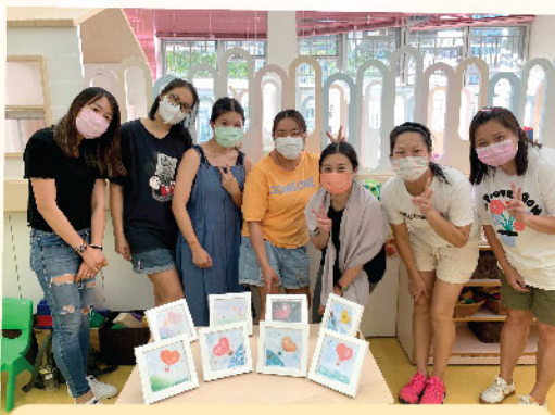
家長體驗和諧粉彩活動，學習專注當下，慢活心靈，輕易栽種平靜之花

生活總遇上大小不同的挑戰，如能在每個人的心田栽種希望和愛的花朵，成為自己或與人彼此祝福，挑戰應可輕易變成學習。本會的幼稚園駐校社工以不同的手法為孩子和父母栽種希望，培育愛己愛人的花朵或花田：