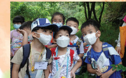
「蜘蛛考察隊」定下明確目標上山尋找大木林蜘蛛，果然不負眾望，大於手掌的雄性大木林蜘蛛及其超大的蜘蛛網活現眼前，考察隊正看得入神！