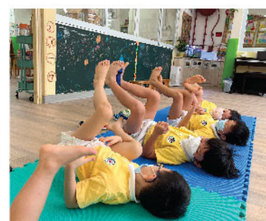
身腦一體，看似簡單的赤腳擲物，非但能有不一樣的視知覺經驗，更同時是群體合作，強化核心與腿部肌力，更有效激活全腦發展。