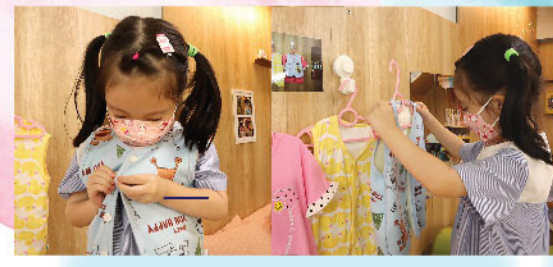
幼兒班浩騰動作俐落地選衫、穿上身再順序從上向下逐一扣上鈕扣，展現良好的專注、理解、組織及行動等綜合能力。