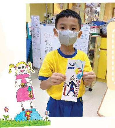
駐校社工為 K3 同學舉辦解難工作坊，小朋友在書簽上寫上自我勉勵的說話，栽種希望之花