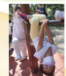
定思輕而易舉地將身體倒掛在單槓上，展現強大的核心肌力和抓握力，同時有效激活視覺神經與視知覺，及身體感知的本體覺！