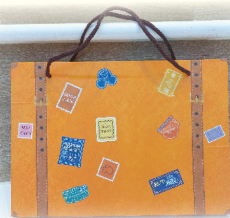
「喜·程」21天快樂家庭之旅