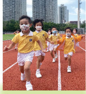
身腦一體，運動即活腦，低班同學在寬敞的運動場上輕快奔跑，使身心放鬆並整合全腦，為一天的學習做最佳準備。