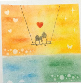
將 6A 品格結合和諧粉彩創作，鼓勵家長在育兒路上與人並肩前行，栽種同行之花