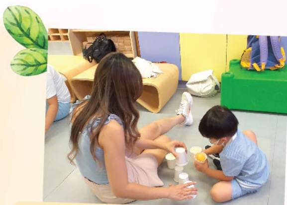
簡簡單單的物資就可以和孩子一同玩樂，彼此共建童真及初心，栽種親情之花