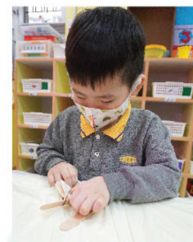
曉揚運用靈活的小手以雪條棒、橡皮筋綁在布上，創作屬於自己的獨家染色方法。