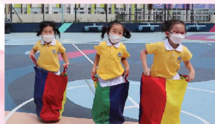
語洋、芷穎及暹升上低班後首次到戶外球場遊戲，寬敞的活動空間及友伴同行令她們更盡情投入！