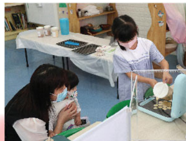
高班顏兒向校園體驗日的參加者講解及示範雞蛋仔烘培做法。