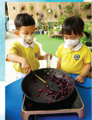
預備班梓鍵和可滙正嘗試製作手工藍莓漿，將藍莓由粒狀煮成糊狀，不只注視外形變化，他們更感到熱力、嗅到香味，是有趣的多重感官經驗。