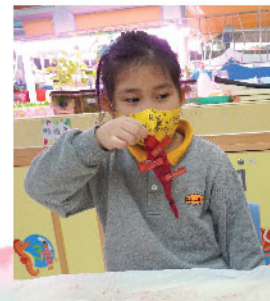
染布放入「兔仔花」染液中煮沸後，洛伊發現煮過的布顏色變成鮮紅色，更有淡淡的香氣。