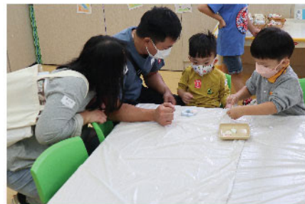
低班彥諾認真又熟練地向新朋友示範擴香石的製作方法。