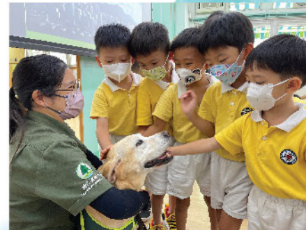
漁護署職員攜同偵緝犬到校向同學宣揚愛護動物的訊息，除認識狗隻的超卓嗅覺外，同學即驚且喜地嘗試輕撫及與牠交談。