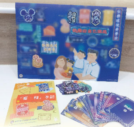
「親子好去處」磁石貼連背景板及底座、「喜·程」任務卡、「喜·程」手記