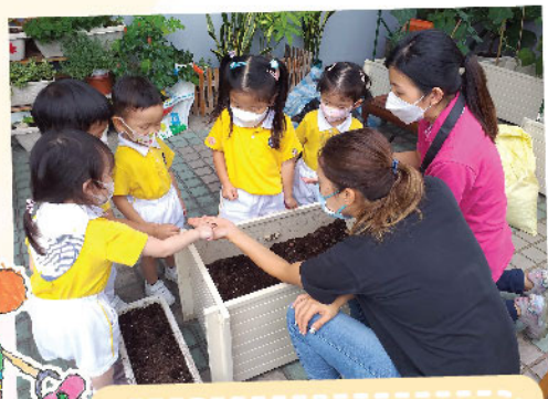
在家長義工的協助下，小小年紀也可參與栽種，細心地將種子放到泥土裡，栽種生命之花