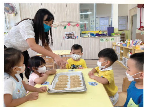
駐校社工和小朋友一起製作傳統月餅，培育孩子珍惜食材並與人分享，栽種友誼之花