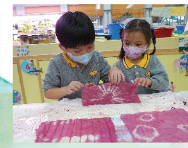
唯堡和熙媛小心翼翼解開染好的布，對出現的圖案很感興趣，唯堡更發現染布的底面圖案相同，更是神奇。