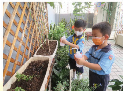
子樂和凱文觀察到九層塔出現枯萎狀況，便一臉認真地澆水，讓土壤保持濕潤，因而發現澆水後泥土的顏色由淺啡色轉變成深啡色。