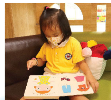
幼兒班的品言興趣明確，喜愛到裝扮區試穿不同衣物，閱讀也最愛看主題為《各種衣物》的圖書。