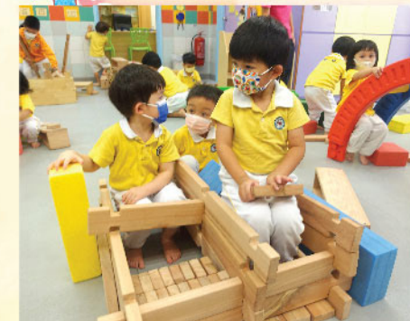
卓謙、曉熙與迦維利用不同組件的積木構建「救護車」，再分別扮演病人、救護員及司機，能綜合情意、社交、語言及知性學習。