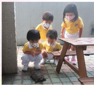
知行、簡言、宇基與宇熾正安靜地觀察小烏龜散步，展現對小動物的尊重及好奇。