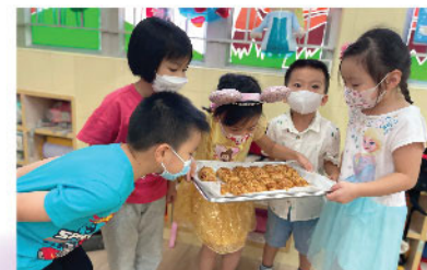
中秋節佳節，孩子再次學習接近失傳的手藝-搓烤手工豬籠餅！取出熱騰騰又香噴噴的出爐豬籠餅，餡飽及接受實在忍不住俯身用力嗅聞！