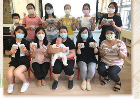
炎熱夏天將至，又是蚊蟲出現的季節，家長義工團隊用草素材，製作天然又芳香的驅蚊包，放在校園以保障學童的健康。