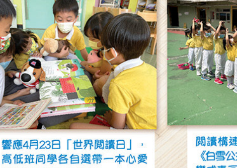
響應4月23日「世界閱讀日」，高低班同學各自選帶一本心愛圖書回校與同學分享。