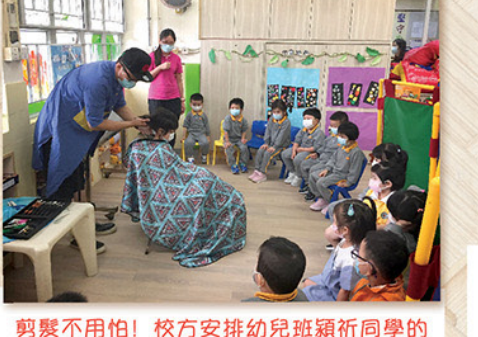
剪髮不用怕！校方安排幼兒班班近同學的髮型師爸爸到校示範及講解，讓孩子們明白整個過程以減少孩子的焦慮，是最實用的生活學習呢！