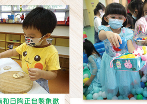
愛烹調的籽楠和日陶正自製象徵著新生命的小雞三文治，既配合復活節節慶，更建立動手做的自信與專注。