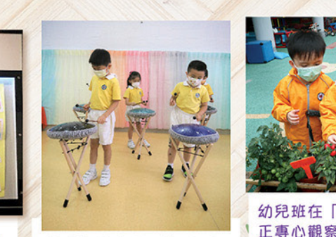
燈軒與訢高及同學正一起彈奏銅舌鼓，聲音悠長迴盪，滋養着孩子的身心靈。