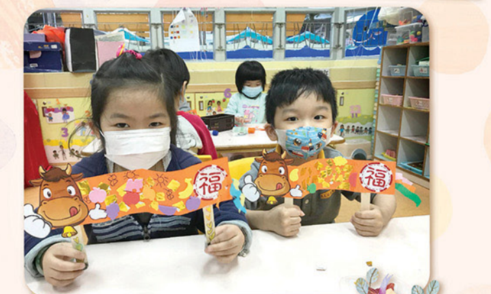
幼兒努力製作祝福裝飾置，將愛和祝福送予家人。