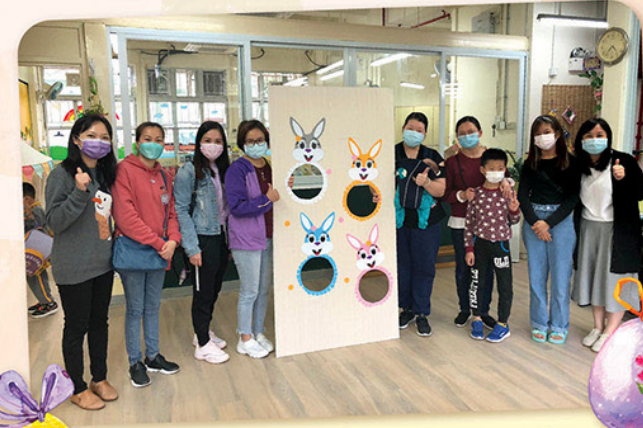
「加點綠家長義工隊」製作復活節遊戲與孩子同樂。

駐校社工與各校的宗長和小朋友同心同行，以多元化的活動，繼續為家庭傳播快樂種子，讓家庭得著滋潤和力量!