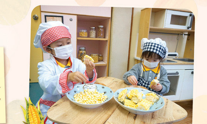
孩子用心剝出粒粒粟米，為製作「粟米魚肚羹」出一分力。