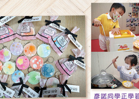
低班孩子直接用指尖沾上粉彩，專注體溫及情感，思考媽媽喜愛的顏色及圖案，創作出獨一無二的隨身小鏡，於母親節為媽媽送上無限愛意與祝福。