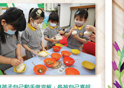
低班孩子自己動手做燉飯，各按自己喜好加入不同餡料，成為獨家又最合胃口的款式。學會的手藝，更帶回家再做，讓家人也可共樂同享。