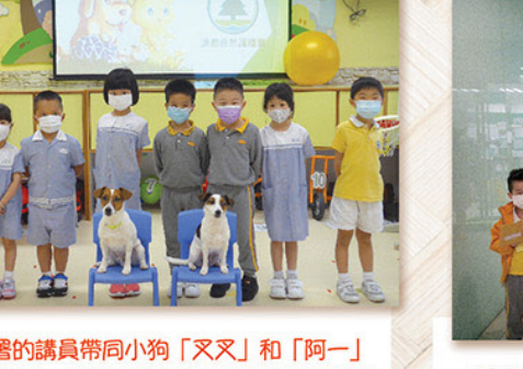
漁護署的講員帶同小狗「叉叉」和「阿一」親善訪校，教導高班同學愛護動物及認識飼養寵物的責任。