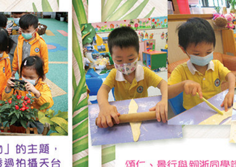
幼兒班在「植物」的主題，正專心觀察或透過拍攝天台栽種的各類植物，發現各種顏色、形狀與形態，更認識各人的不同喜好。