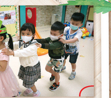
疫情下生活有很大變化，但不變的是繼續按時為孩子舉行生日會，讓孩子感受愛與歡樂。