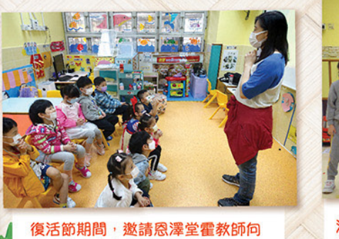
復活節期間，邀請恩澤堂靈教師向低班孩子分享耶穌復活的訊息，並誠心禱告願人人安康。