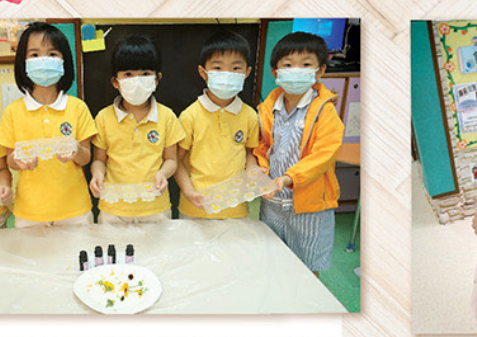
高班孩子合力製作金盞花肥皂作為母親節禮物，期望媽媽收到禮物時感到驚喜又窩心。