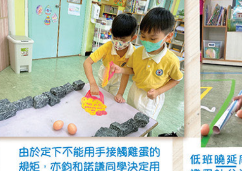
由於定下不能用手接觸雞蛋的規定，亦鈞和諾謙同學決定用膠筒不停撥向雞蛋，藉風力將蛋吹至終點。