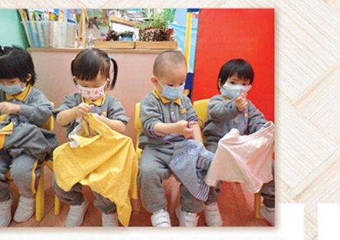
預備班孩子正學習自己掛衣服，活動既是自信心的建立，更是專注、記憶、理解、模仿及手眼協調的生活學習。