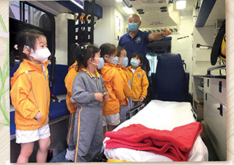
年紀小小，且是身體安康地登上救護車，由救護員講述車內設施及功能，實在是極難得的經驗，低班孩子正十分用心地觀察及聆聽。