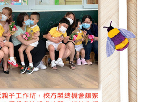
「惜」玩親子工作坊，校方製造機會讓家長及孩子有更親密的相處時間，讓彼此經驗聆聽及表達，增進親子關係。