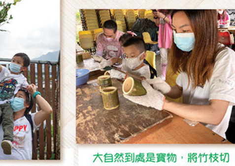
大自然到處是寶物，將竹枝切割為竹筒，再經培御和媽媽用心加工，即成為獨一無二的竹製高跳，是最傳統的玩具。