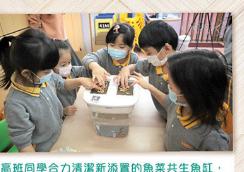
高班同學合力清潔新添置的魚菜共生魚缸，再把小麥草種子放到上層的培植土上，嘗試「養魚不用換水，種菜不用淋水施肥」的做法。