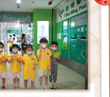
低班孩子親自繪畫感謝話，再透過郵寄給爸媽，相信父母收到後一定驚喜萬分。