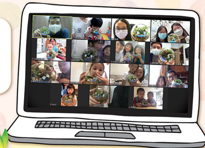
親子綠洲 - 創意盆景DIY親子體驗工作坊，家長與孩子一同享受愉快的上午，在家中也能親親大自然，安定心靈。